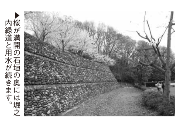
▲桜が満開の石垣の奥には堀之内緑道と用水が続きます。

市役所南側の神明郵便局前から日野バイパスの神明1丁目信号を越えて坂道を下り、15段ほどの階段を下りると、左側斜面の白い石垣が目飛び込んできます。高さ4～5メートルはあるでしょうが、石積みのみきれいな石垣が80メートルほど