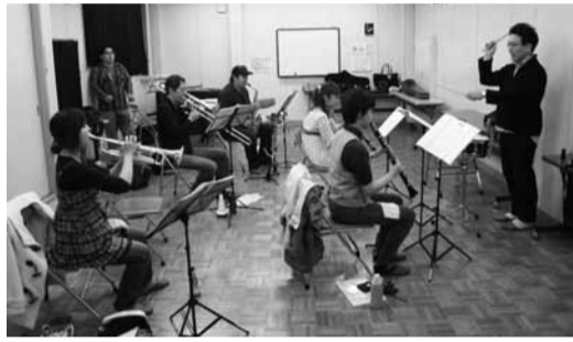
▲みんなで演奏するって楽しい♪♪♪

なお、神明1丁目の信号を渡ってすぐ左側に人ひとりがやっと通れるほどの小径があります。第10緑地の