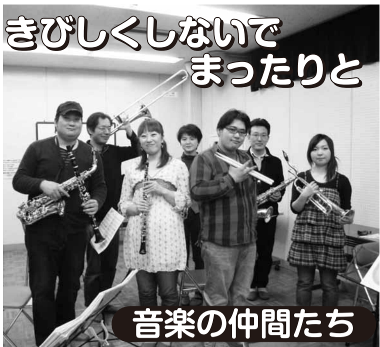
▲練習終わって、ハイポーズ

今年春の訪れが遅く、なかなか冬物衣料が手離せませんでした。4月18日の降雪(41年ぶりの遅雪)には本当に驚きました。