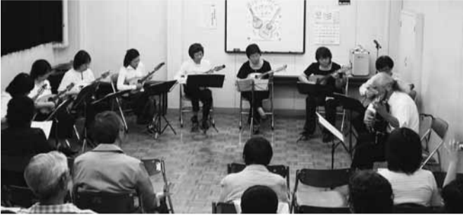
▲マンダリンの華麗で透き通った音色を皆さんへお届けします。

点字「公民館だより」は、ぐるーぷ「あいの会」の協力でできています。日野市立つばさ・東京光の家・中央図書館・高幡図書館・中央公民館および同高幡台分室にあります。お知り合いで目の不自由な方にも、お勧めください。