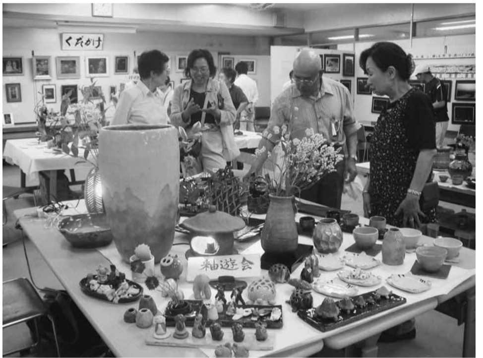
▲世界に一つだけの陶芸作品の数々