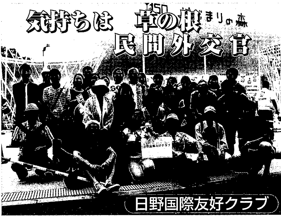
みんなで楽しく課外授業 — 横浜開港150周年記念博覧会にて —

それぞれの雰囲気を持ちながら、友好クラブの特徴は、親身な指導にあります。他所の一斉授業で覚え切れなかった言葉や、文法上の疑問をもつて飛び込んで来る人にも対処します。近隣の子どものいたずら