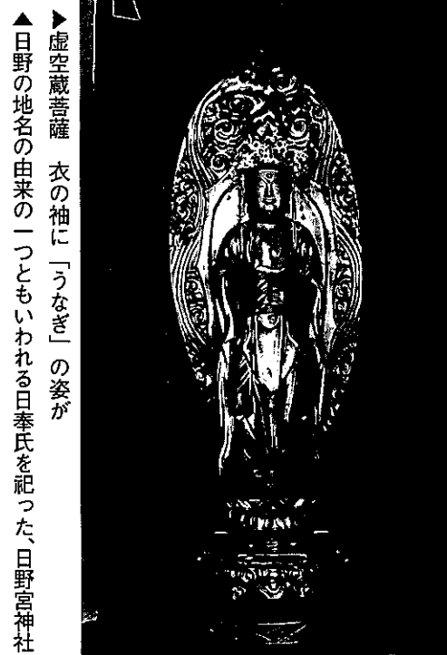
虚空蔵菩薩 衣の袖に「うなぎ」の姿が ▲日野の地名の由来の一つともいわれる日奉氏を祀った、日野宮神社