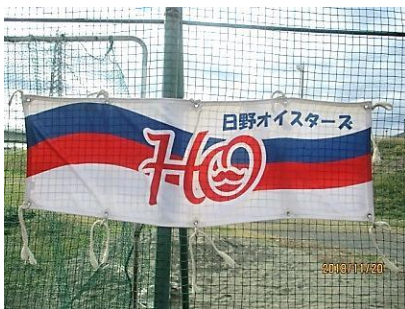
赤青白の日野オイスターズの旗