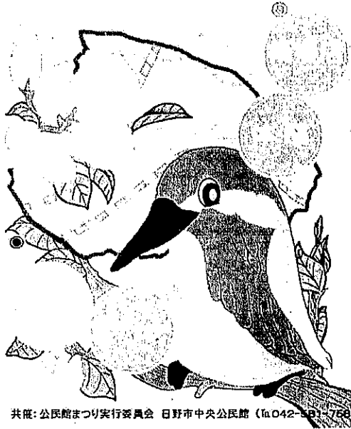
共催: 公民館まつり実行委員会 日野市中央公民館 (TEL042-581-7580)